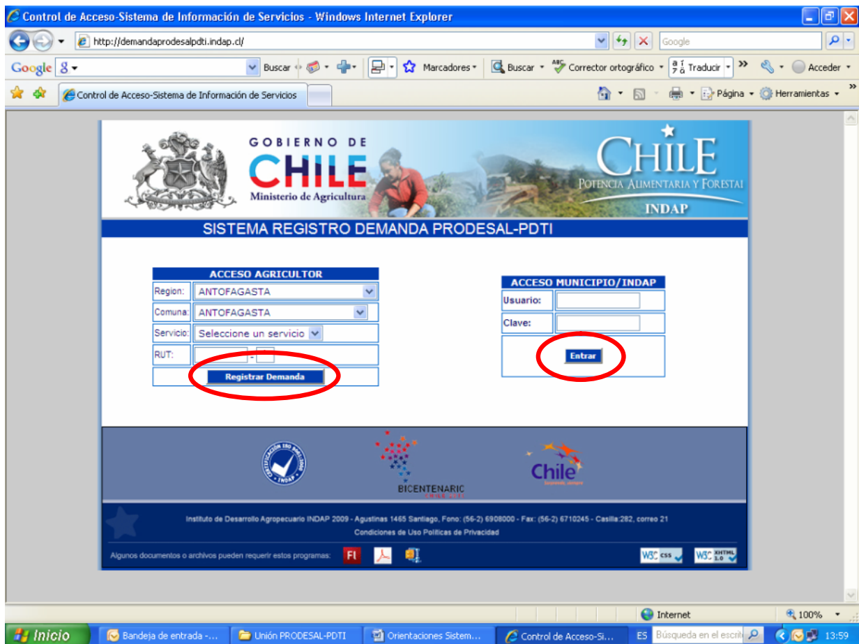
Figura 1: PORTAL DE ACCESO A SISTEMA DE REGISTRO DEMANDA PRODESAL-PDTI.